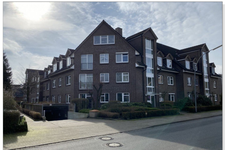
Wohnung mit Balkon, Tiefgaragenstellplatz