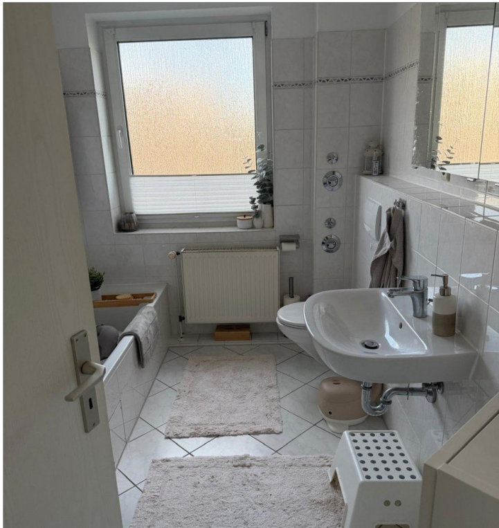
Badezimmer mit Fenster