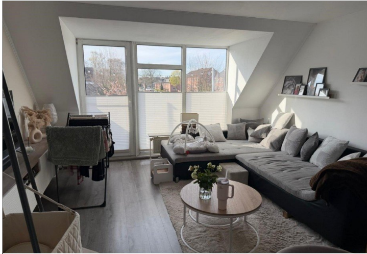
Wohnzimmer mit Südbalkon