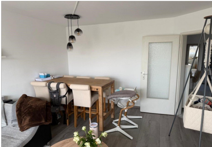
Wohnzimmer / Essbereich