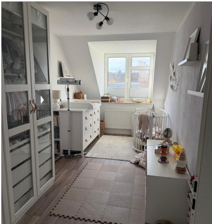
Kinder- oder Arbeitszimmer