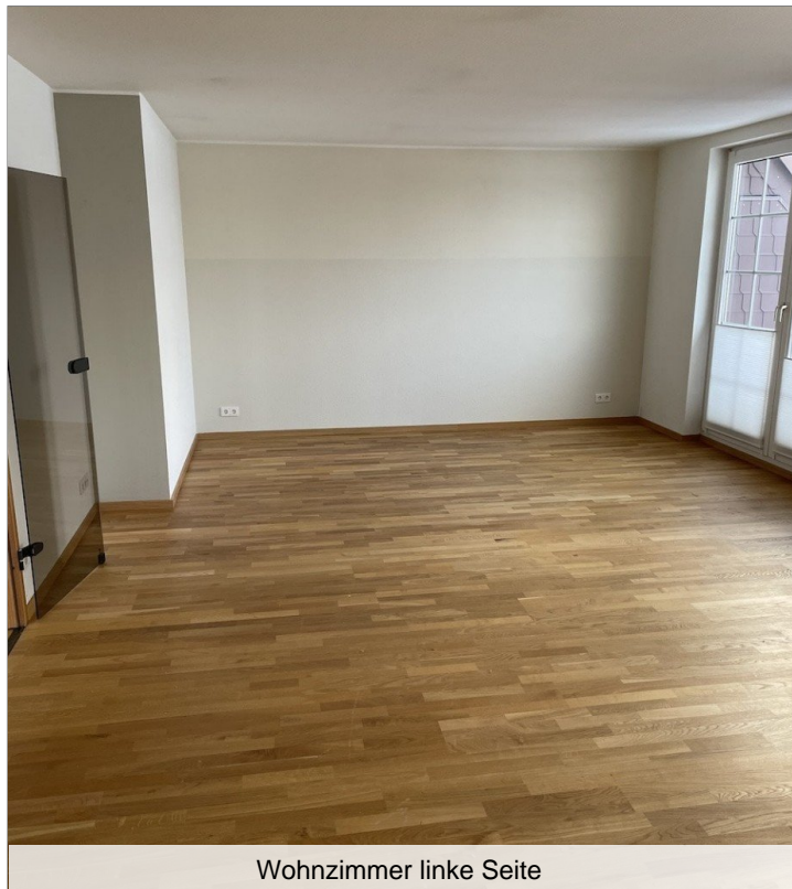
Wohnzimmer linke Seite