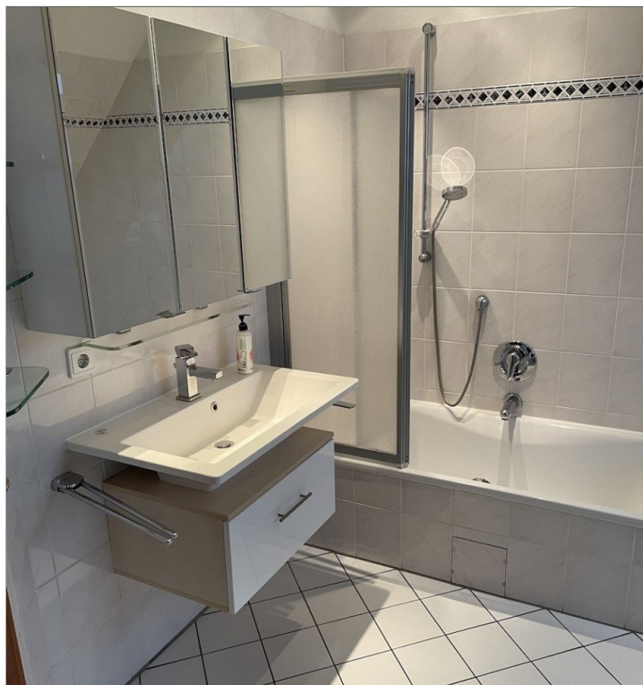
Vollbad vom Schlafzimmer