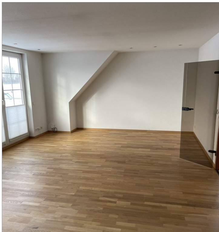
Wohnzimmer rechte Seite