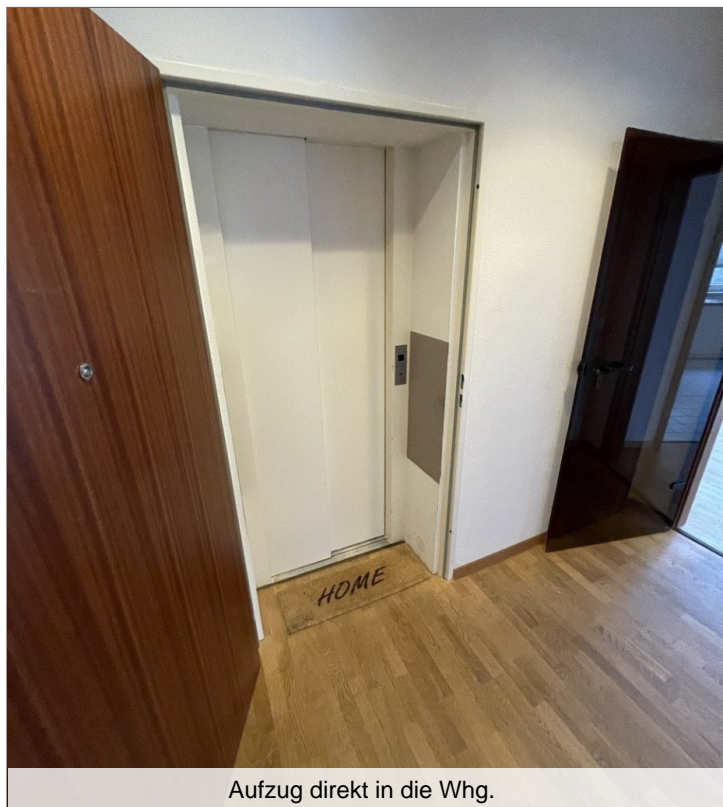
Aufzug direkt in die Whg.