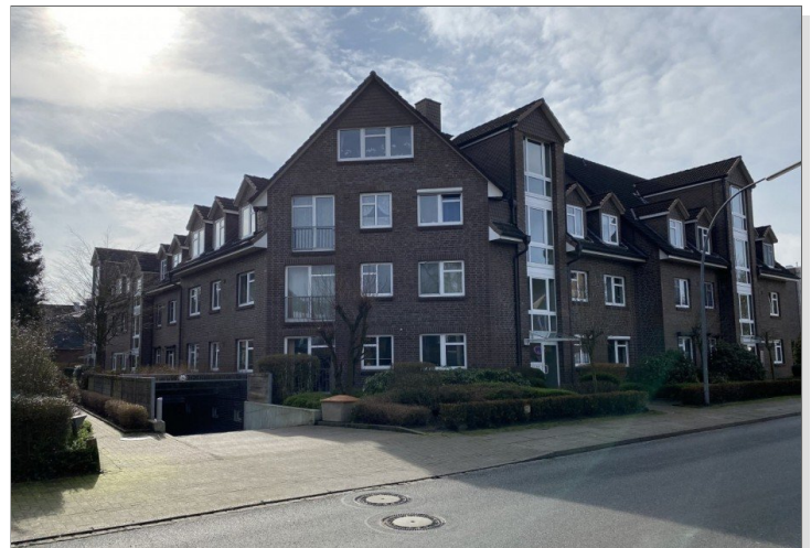
Wohnung mit Balkon, Tiefgaragenstellplatz