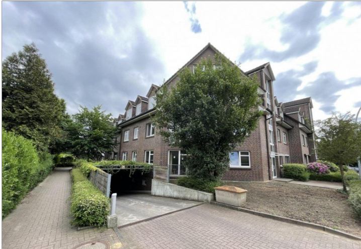
Wohnung mit Balkon, Tiefgaragenstellplatz