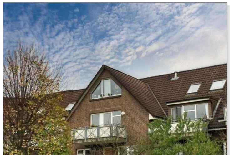
Wohnung mit Balkon, Tiefgaragenstellplatz