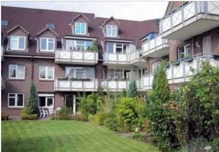
Wohnung mit Balkon, Tiefgaragenstellplatz